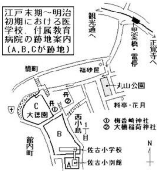
図3. 医学所・養生所跡地への案内図 A: 日本最初の洋式病院「養生所」設立(1861, 文久元年). 明治元年「長崎府病院」, 2年「長崎県病院」となる。 B: 移転新築なった近代的医学校「医学所」(1861)の場所。 C: 明治3年「梅毒仮病院」設立。同12-18年「長崎県病院」が移転, 同35年まで存続。「大徳園」は江戸末期に大徳寺の庭園であった場所。現在は住宅地。

看護室は病棟の一階中央にあり、階段の下の空間を利用して、広さは2間四方(8畳、約13㎡)で、階段を利用して一階、二階の病棟を一括管理していた。この構造形式はその後日赤病院をはじめ多くの病院で採用され、太平洋戦争後のしばらくの間、高層病棟が普及するまで使用されていた。