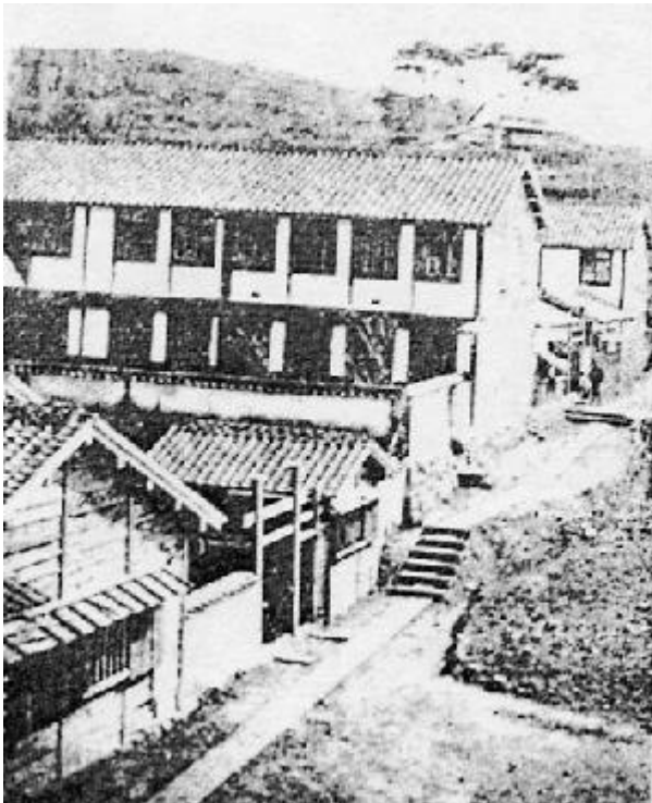
図2．1865年頃の精得館（旧養生所）の写真．（文献4．p.8）