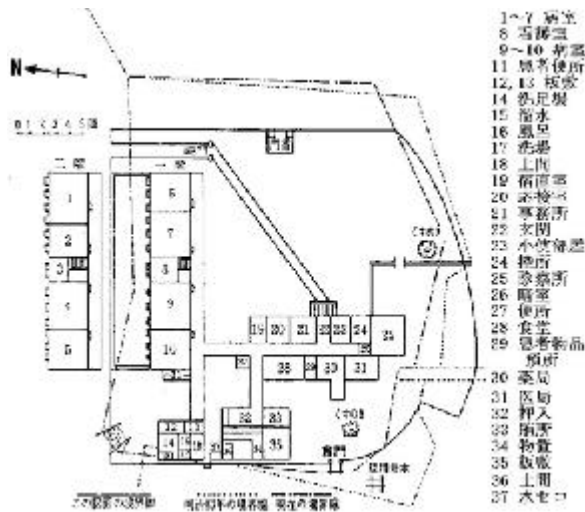
図5．明治14年（1871）に改築なった梅毒病院． （文献6，p.81）