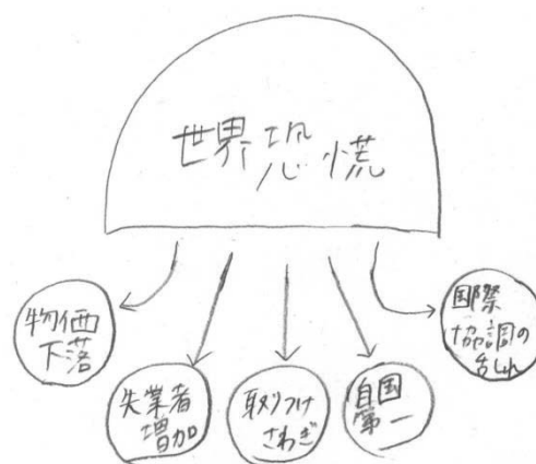
学生作成の思考ツール

なお、学生については、思考ツールを自ら作成する経験もさせたが、学生が作成したものの一つを右に示す。