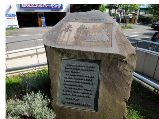
図 7 横浜海浜住宅地区跡地の「未来」碑 横浜市中区。区画整理事業区域の地図が示されている。2015 年撮影。