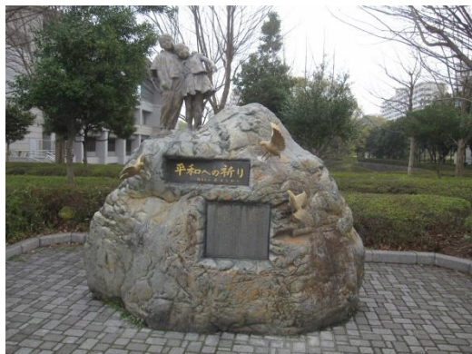
図 4 グラントハイツ跡地の「平和祈念碑」 東京都練馬区(光が丘公園)。2013 年撮影。

ここまで、米軍基地跡地のモニュメント類にはめばしいものがなく、記念することが忌避されていると考えられる事例も少なくないことをみてきた 7) 。モニュメントや解説板がある「選別」であっても、積極的な記念は皆無である。また、「復旧」とはいえ、基地跡地の記念が忌避され、あえてモニュメントがつくられていないようにみうけられる事例すらあ