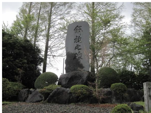
図 6 東富士演習場跡地の「解放之碑」 静岡県御殿場市。2011 年撮影。