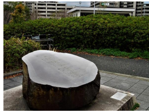
図3 立川飛行場跡地の「雨のステーション」詩碑解説板

東京都立川市。荒井由実詩碑右下の小さな解説板に、西立川駅が「米軍基地前の「さみしい」駅だった」と紹介されるのみ。2016年撮影。