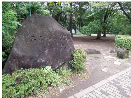
図 5 府中空軍施設跡地の「平和の森公園」表示 東京都府中市。公園名の表示であるがモニュメントに似た存在感がある。2015 年撮影。