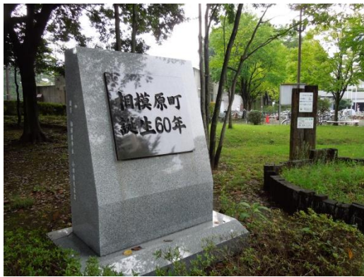
図2 陸軍医療センター跡地の「相模原町誕生60年」碑