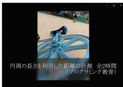
図1 動画教材のサムネイル