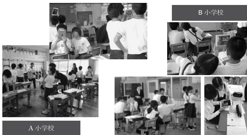
図2 授業実践の様子

B 小学校では，「平和教育をまとめよう」をテーマとし，A 小学校と同様に担任である小学校教諭が授業を構成し，教示した（45分×2時間）。また，児童らは事前学習として訪問する6地点について調べ学習をしており，「修学旅行ノート」に児童らが学んだ内容をまとめていた。本授業実践において，児童らは教材の操作方法に関する教示を受けた後，訪問した被爆遺構の振り返りとして，1地点10分間でコンテンツの視聴および，修学旅行ノートに新たな情報を追記する活動を各6地点において実施した。