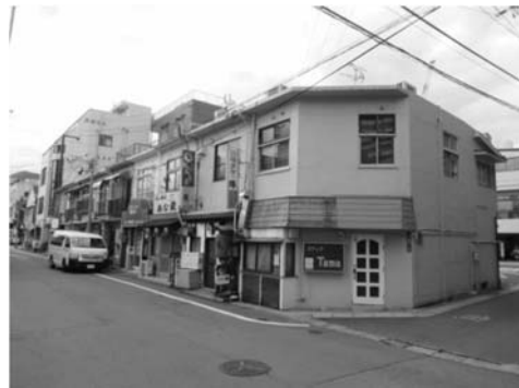
図5 中園町の「マリア街」移転地区 2019年撮影。

以上、バラック地区の空間的排除言説を3点から確認した。物理的な撤去だけでなく、あるいは撤去に先行して、バラック地区を排除する言説がみられたのである。