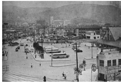
図3 駅前広場バラック地区

上述したように早い時期からバラックが建てられたとみられるが、1948年1月の米軍空中写真ではバラック地区と呼べるほどのバラック群は見当たらず、その後にバラック地区の形成が進んだものと考えられる。当初は「おでん屋街」と呼ばれており、飲食店や各種小売店舗との兼用住宅が多い地区であったようである。