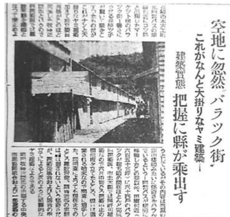
図4 紺屋町バラック地区の報道

1950年から始まった長崎市内の「不法占拠」バラックの県や市による撤去は1953年頃から本格化し 31) 、1960年代初頭にはほぼ終了する。取りこわすのみか、換地を用意するかなどの県・市の対応はまちまちであるが、あらゆる公有地上のバラックが撤去対象となった。公園や区画整理換地は切迫していないため撤去は後回しにされている。すなわち、湊公園(1956年10月撤去)、中央公園(予定地、1963年11月撤去)、元船町(民地と換地予定、1966年12月退去要請)、袋町(区画整理換地、1960年2月撤去)がそうである。このほか、上述