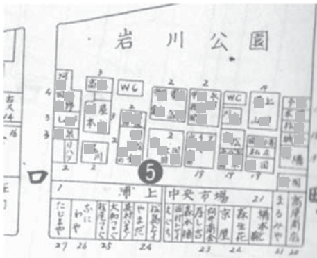
図6 バラック地区化した岩川公園