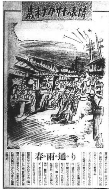
図1 春雨通りバラックの描写 『夕刊ナガサキ』1949年12月27日。

最終的に、春雨通りバラックの各店舗は銅座川暗渠上の2階建て店舗兼用住宅と、一部は春雨通り歩道上2階建て仮設店舗に收容されることになった。銅座川暗渠上への移転は1951年11月(西側54戸、銅座市場)、1952年12月(東側74戸、思案橋商店街)に分けて進められた 11) 。1953年末に歩道上仮店舗に5年期限で入居した120戸は、退去期限の1959年1月に市側と再び対立するものの最終的には撤去された 12) 。また、新生協同組合54戸は1952年2月に市街北部の住吉町へ集団移転している(住吉中央市場) 13) 。