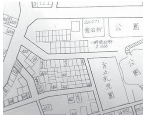
図7 城山町県有地とその周辺

図中央がバラック地区。1961年版『ゼンリンの住宅地図』による。なお、バラック地区の上(西)の「(一時)宿泊所」もバラック撤去者用住宅。