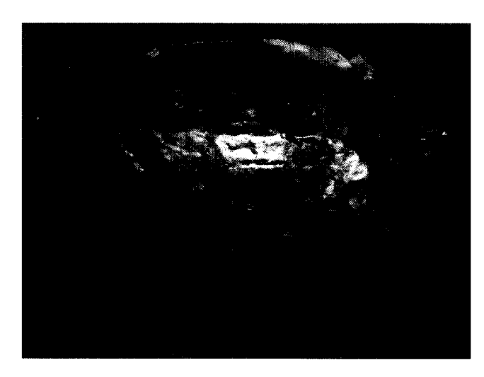
図2 おが屑状の微生物担体 便槽内に20kg 充塡し、年に1回3kg 補充する。

現在市販されているバイオトイレは3機種あるため,調査対象の機種選定のためにまず3機種の実物の