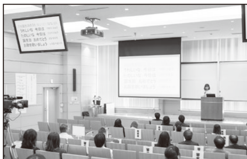
【コンテストの様子】

応募時に提出された発表概要をもとに選考を行い、英語部門 6 名（学外 1 名）、初習外国語部門 6 名：中 2 名、韓 2 名、日 2 名（学外 1 名）が発表者として選ばれた。英語部門に棄権者が 2 名出たため、最終的に 10 名が発表を行った。発表者、参観者併せておよそ 110 名が参加し実施された。