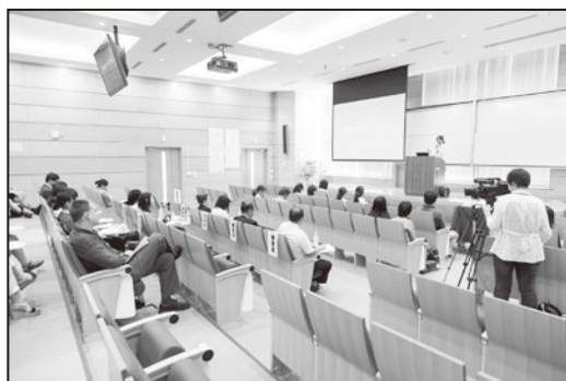
【コンテストの様子】

応募時に提出された発表概要をもとに選考を行い、英語部門 8 名（学外 1 名）、初習外国語部門 4 名：仏 1 名，日 2 名（学外 1 名），韓 1 名が発表を行った。発表者、参観者併せておよそ 80 名が参加し実施された。