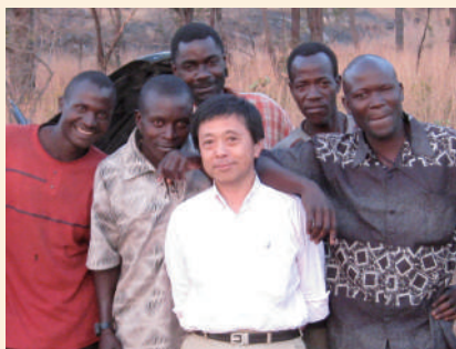
研究のために出かけたザンビアで、移動に使っていたクルマに生じた故障を通りすがりの若者たちが見事なチームワークで手早く修理してくれた。「人の価値は人(他人)のために何ができるかで決まる」と再認識した一日だった。

しかし現在は、自然や社会環境に関する諸問題を地球規模で考えなければならない時代です。