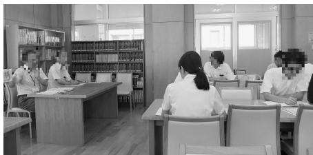
図3 学校訪問の様子

長崎市立A中学校にてフィールドワークが実施された(図3)。創立70周年を迎える校舎は、現代化が図られた部分と設立時のままの部分とが共存しており、それぞれの学生が様々な気づきを得ていた。施設見学の後は当該校の校長・教頭に対して、気になった点などの質問を行った。