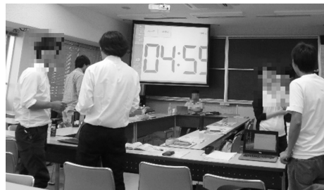
図4 ロールプレイの様子

演習課題として、いじめ、出会い系、不登校の問題がケースとして示され、それらにどのように対応するか、個人で考えた。