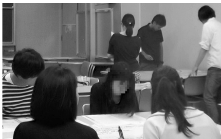
図2 ケースメソッドの様子

4人程度のグループに分かれて、ケースメソッドが実施された(図2)。ケースの内容は避難所運営である (1) 。個人で対応を考えたのち、グループでホワイトボードシートに意見を書き出し、各グループが発表を行った。