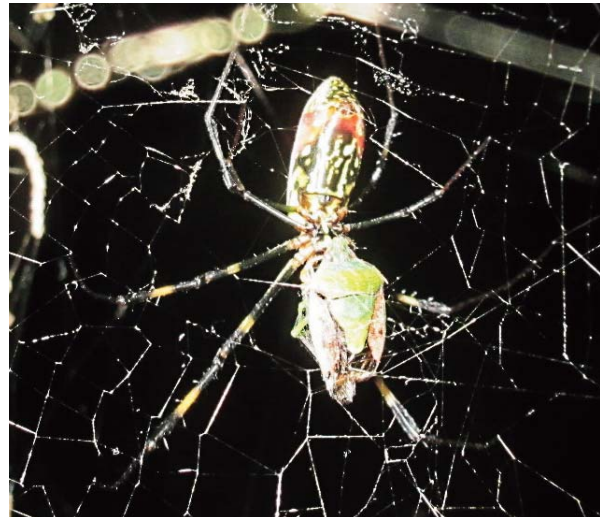
図1. ジョロウグモ雌成体と糸で巻かれずに捕食されたチャバネアオカメムシ。

ジョロウグモは獲物がかかるといきなりかみついて、それから糸を巻くとされている。こうした捕虫行動はアシナガグモやトリノフダマシと同じで捕獲の量の少ないクモの特徴である (池田 2019)。長崎大学教育学部前にいたジョロウグモがカメムシを糸で巻かないで捕食していたのは、カメムシの好ましくない臭いを